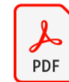
LOGISTICS_6A03_ MOSTRADOR CON PUERTA_FRONT...